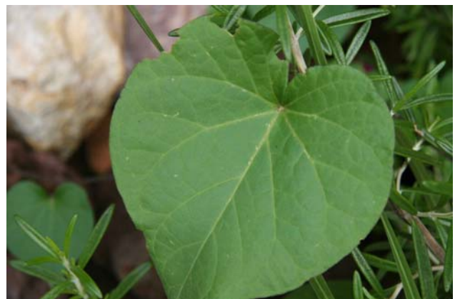
Een beeld van het hartvormige blad..