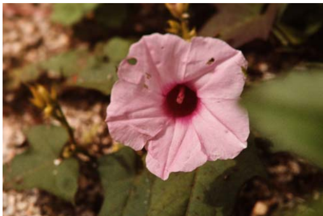
Bloem van bataat, Ipomoea batatas .

Ipomoea batatas , Zoete aardappel, Switi batata of kort bataat wordt veel gekweekt, vooral op Madeira en ook in de neotropen, om de eetbare stengelknollen. Het blad van deze soort is erg variabel, meestal breed ovaal, soms breed hartvormig, soms handvormig ingesneden als blad van plataan of esdoorn. Ook de bloemkleur kan verschillend zijn, meestal bleek of lila met donkere keel in de kroonbuis.