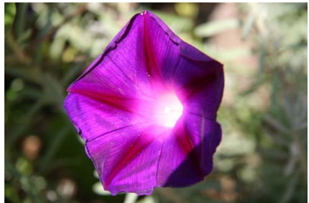
Verschralende bloem in de middagzon.