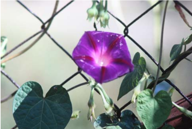
Prachtwinde tegen kippengaas in West Turkije.