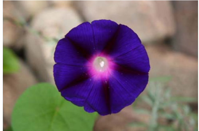
Deze bloem is indigo, donker blauwviolet.

Meer dan manshoog klimt deze soort zelden, met zachte steun of tegen een hek misschien wel enkele meters. Het maximum dat ik heb gezien was moeilijk te schatten, vanaf een glooiende oever of op een spoordijk, tegen ruige tuinhagen; het leek me ongeveer vijf of zes meter.