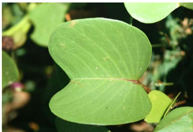
Blad van Ipomoea pes-caprae .

Ipomoea pes-caprae , geitenhoefblad, groeit aan veel tropische kusten, op de hoogwaterlijn. Wetenschappelijke en Nederlandse naam verwijzen naar de kenmerkende bladvorm. De bloei is roze en lijkt enigszins op het bloeien van de Zoete aardappel. Deze soort heeft in Suriname twee namen, nl. Jorka batata, dat wil zeggen spookaardappel, geest van een aardappel of Krape wiwiri hetgeen schildpadwier of schildpadkruid betekent.